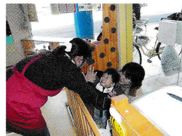
わはは・ひろば坂出